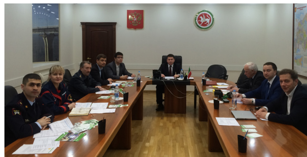
Первая встреча рабочей группы проекта «Автотрезвость» по республике Татарстан. 2 марта 2017 г. Г. Казань.

Республика Татарстан - второй регион, где компания «Эфес Рус» поддерживает проект. В Ульяновской области, где проект «Автотрезвость» реализуется с 2015 года, в 2016 году он был признан лучшим некоммерческим проектом года.