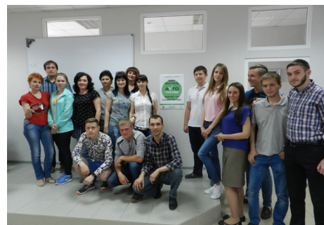
Занятия «Алкоголь и автомобиль» проводятся для опытных и начинающих водителей в автошколе «На Южном». Сотрудники управления ГИБДД проводят профилактические занятия со студентами колледжей и вузов области. Курск. 2017 г.