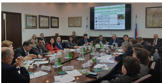
Участники партнерской встречи за круглым столом в РСПП. 31 января 2017 г.