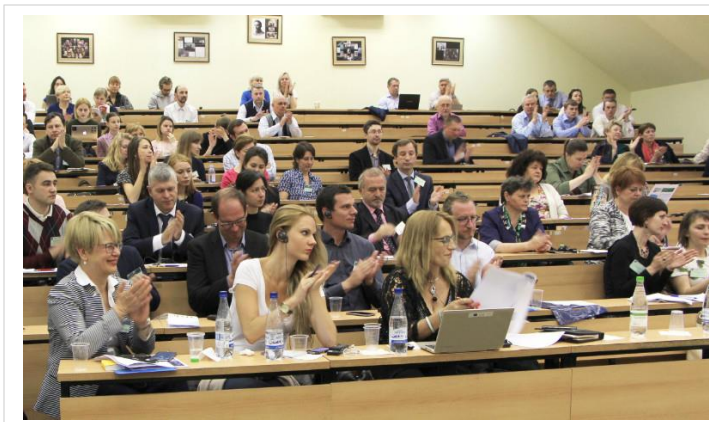
Участники конференции в МГППУ. 26 мая 2017 г. .

В мае проект «Автотрезвость» стал значимой составной частью первой в России международной научно-практической конференции «Психология дорожного движения: вопросы теории и практики», проходившей в Московском государственном психолого-педагогическом университете (МГППУ).