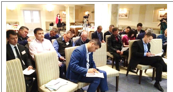
Семинар для руководителей и партнеров. 31.05.2017. г. Стерлитамак, РБ.