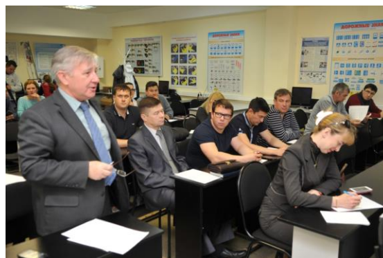
По окончании пресс-конференции в Татар-Информ в г. Казани, руководители и преподаватели автошкол стали участниками семинара на базе учебного центра Федерации автошкол РТ..7.06.2017

автошколах и в соответствии с этим подготовить планы на 2018 год. Участниками проекта в республике стали четыре министерства, Федерация автошкол РТ, общественные организации и СМИ. Читайте также: http://www.tatar-inform.ru/news/2017/06/06/556627/ , https://www.business-gazeta.ru/news/347993