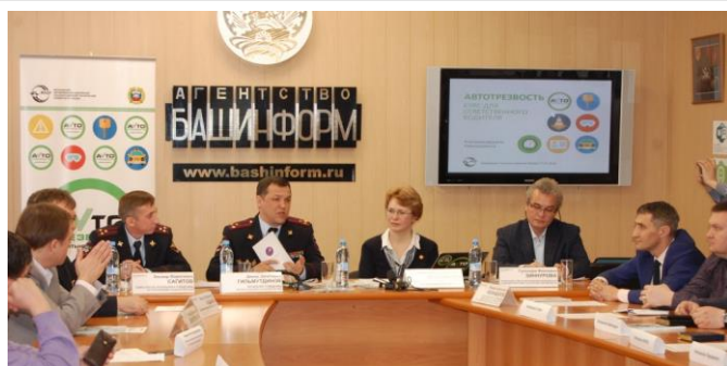
Выступление начальника ГИБДД Республики Башкортостан на круглом столе. Уфа, 19.04.2017

50 автошкол страны смогут ввести в свои программы интерактивный курс «Алкоголь и автомобиль». По уже сложившейся практике в каждом регионе прошли пресс-конференции или «круглые столы», где руководители профильных ведомств и организаций презентовали начало проекта. Более 60 преподавателей автошкол прошли специальное обучение и получили полный комплект учебного модуля «Алкоголь и автомобиль» (пособие для преподавателя, презентация, видео-ролики и очки «Фатальное зрение») для начала интерактивных занятий в своих школах. Начались исследования по изучению общественного мнения по проблеме нетрезвого вождения путем проведения интервью с целевыми группами участников проекта, анкетирования и тестирования курсантов.