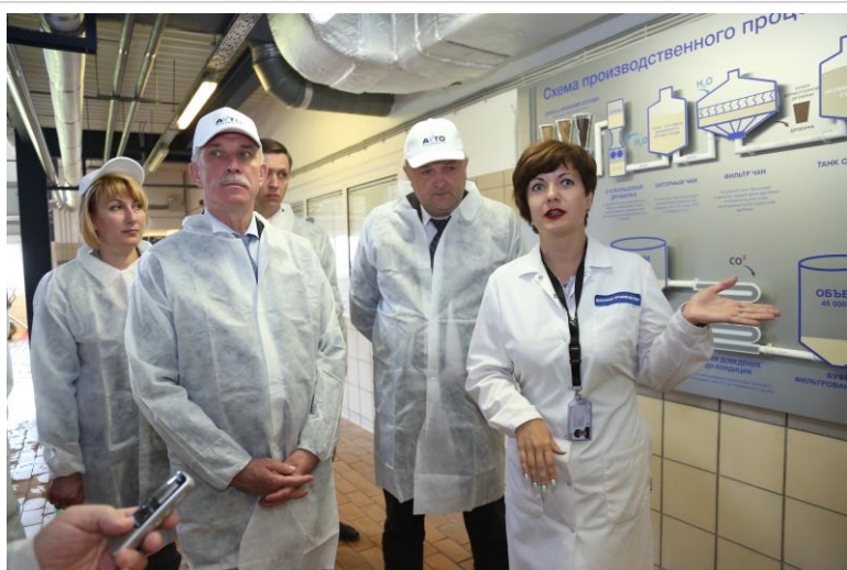
Вместе с сотрудниками «Эфес Рус» Губернатор Ульяновской области поддерживает социальный проект «Автотрезвость». Г. Ульяновск 14.07.2017 г